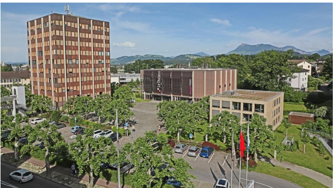
Gemeindefhaus (links) und Le Théâtre (Mitte)

Le Théâtre verfügt über öffentliche 120 Parkplätze direkt vor dem Haus. Weitere Parkmöglichkeiten stehen im gegenüberliegenden Parkhaus oder in der näheren Umgebung zur Verfügung.