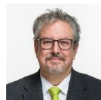
Nationalrat Beat Flach (GLP, AG)