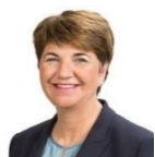
Bundesrätin Viola Amherd (CVP) Chefin VBS