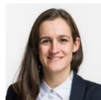
Nationalrätin Marionna Schlatter (Grüne, ZH)