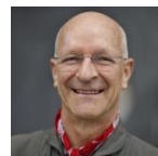
Prof. Claude Nicollier ESA Astronaut, ehem. Militärpilot